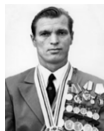
Борис Шахлин, гимнаст (27 января 1932 – 30 мая 2008)

Юбилей Тюменской области – хороший повод вспомнить тех, кто прославил регион далеко за пределами страны. В топ-10 вошли призеры и победители Олимпийских игр, которые начинали свой спортивный путь у нас или добились наивысших результатов, став представителями Тюменской области.