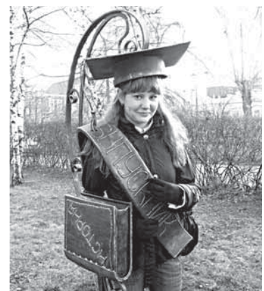
2 ПАМЯТНИК СТУДЕНТУ Примерить роль