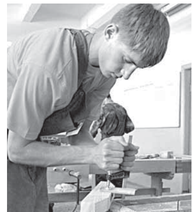
5 ПРОФОБРАЗОВАНИЕ По камушку от регионов