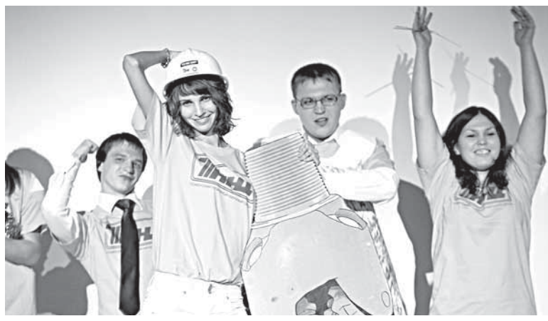
Победитель КВН – команда Тюменского нефтяного научного центра

Примечательно, что в 2010 году предприятия в зоне ответственности