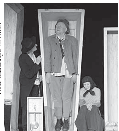
14 ЗОЛОТАЯ МАСКА Мыльные пузыри и гробы