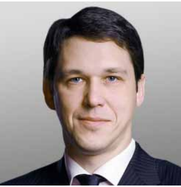
Владимир Авербах , директор департамента электронного правительства Минкомсвязи

«Нас очень впечатлил уровень взаимодействия с органами власти и технологические решения, которые применяются в Тюменской области. Все мы знаем, что Электронное правительство создавалось в основном для того, чтобы электронные услуги оказывались просто и удобно. А степень автоматизации и удобство госуслуг для человека в вашем регионе просто поразительные».